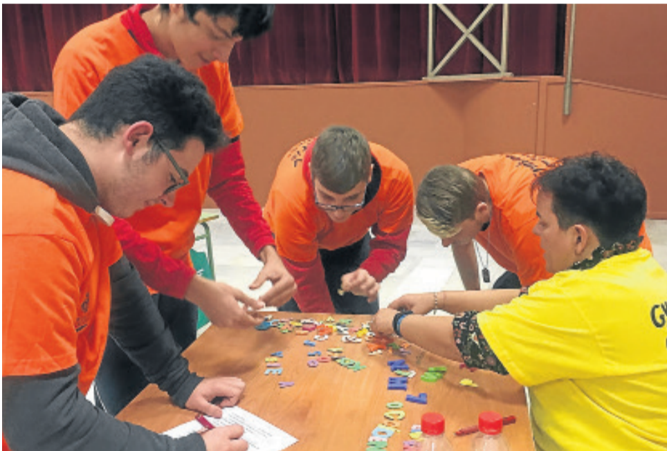
Uno de los grupos en la prueba de las letras.