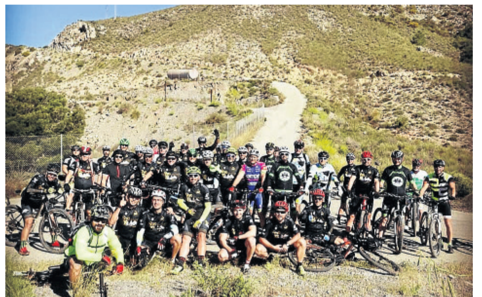
Salida del Club Deportivo Almagro de Cuevas.

Los miembros del Club Deportivo Almagro de Cuevas muestran, así mismo, su agradecimiento por el apoyo que encuentran en el Ayuntamiento.