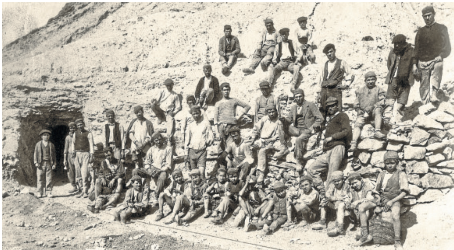
Arriba, imagen de mineros adultos y niños de la colección M. Guillén Riquelme; abajo, imágenes del capataz y el niño en las minas, de la colección de Pedro Perales Larios.