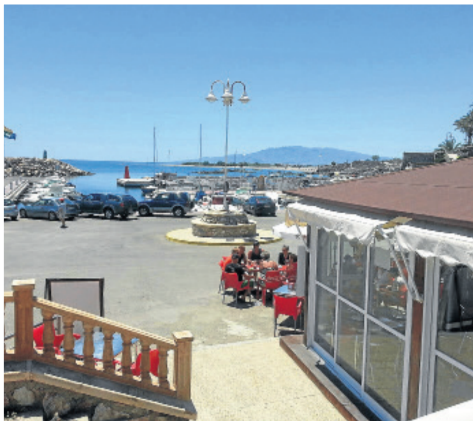
Desde hace quince años el establecimiento atiende todo el año a pies del puerto.

Aquello era una novedad en la zona, Lázaro y su familia importaron este modelo de negocio. Sin embargo, el que habla con ellos y disfruta de sus explicaciones a bordo de su barco con fondo de cristal o de un rato de charla