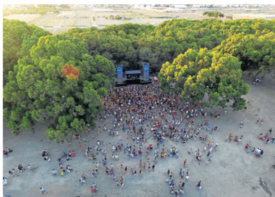
Camping Stage en el festival de Dreambeach en Cuevas.