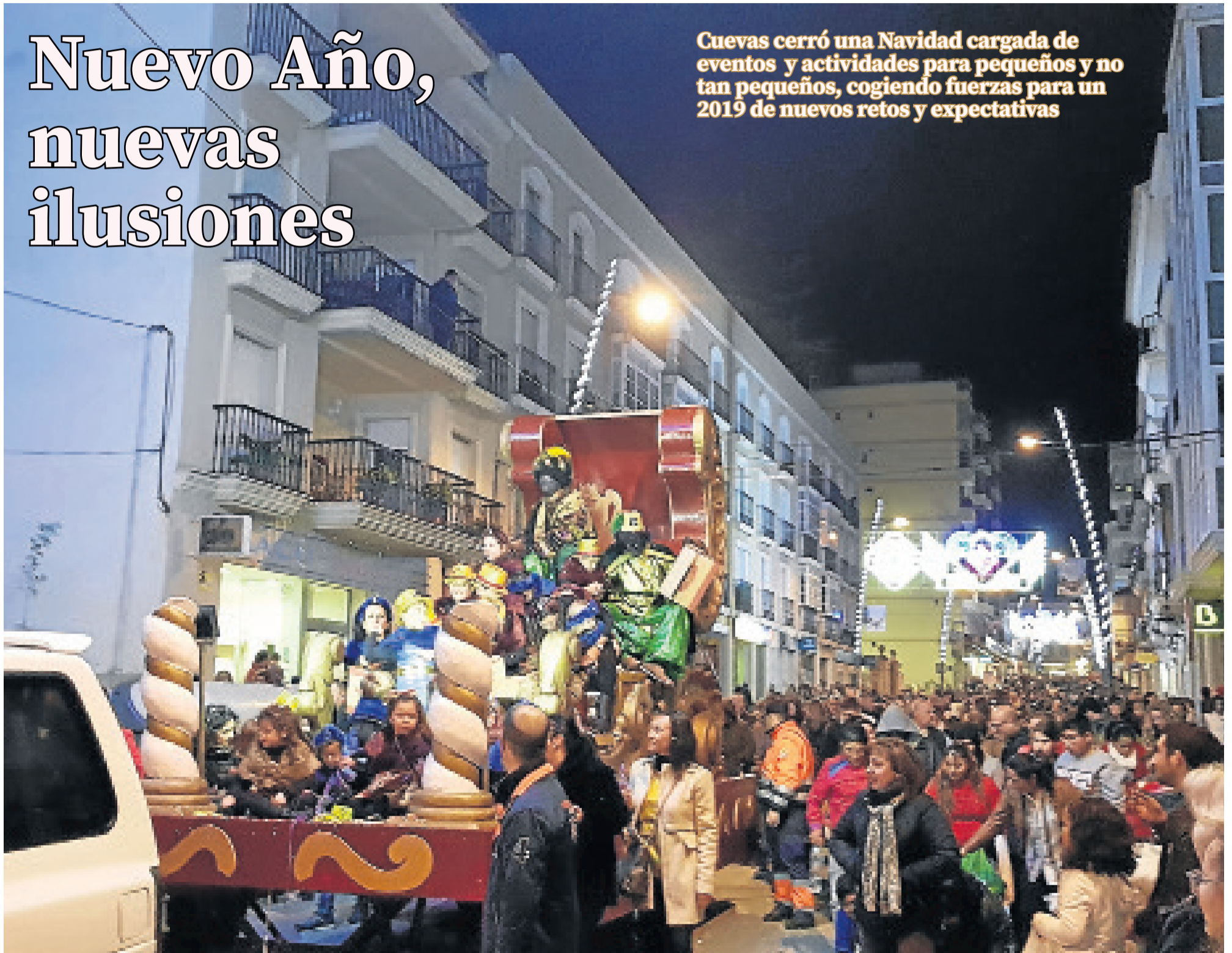
La cabalgata de Reyes Magos cerró los eventos de una Navidad cargada de actividades y de diversión, entretenimiento y alegría compartida en las calles cuevanas.

Cuevas cerró una Navidad cargada de eventos y actividades para pequeños y no tan pequeños, cogiendo fuerzas para un 2019 de nuevos retos y expectativas