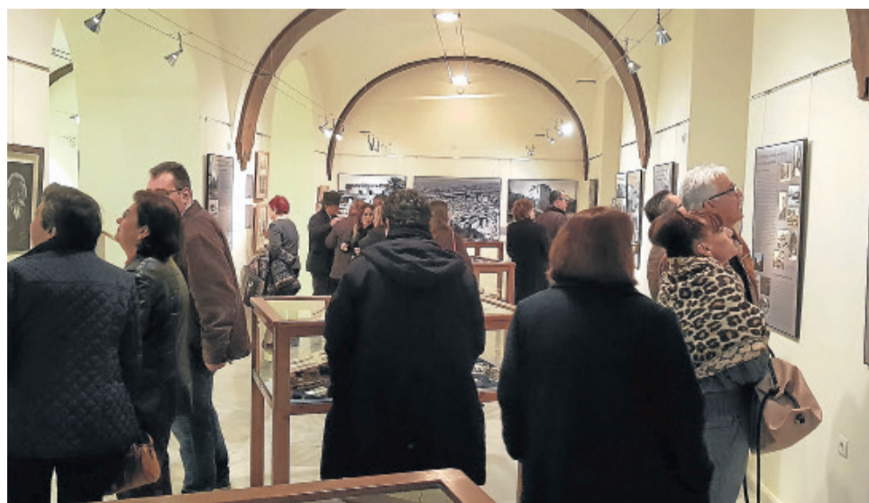
La apertura oficial de la exposición llenó la Sala de Exposiciones de la Tercia del Castillo.

"El Castillo de Cuevas del Almanzora seguirá siendo el centro neurálgico de los actos que se van a ir desarrollando durante este año, como serán un ciclo de conciertos de música renacentista, una recreación histórica de un rapto que tuvo lugar en el Castillo en el siglo XVI, un mercado medieval, entre otras, que también se harán llegar a los colegios del pueblo y el instituto, con el objetivo de que todos participemos de una celebración tan especial"