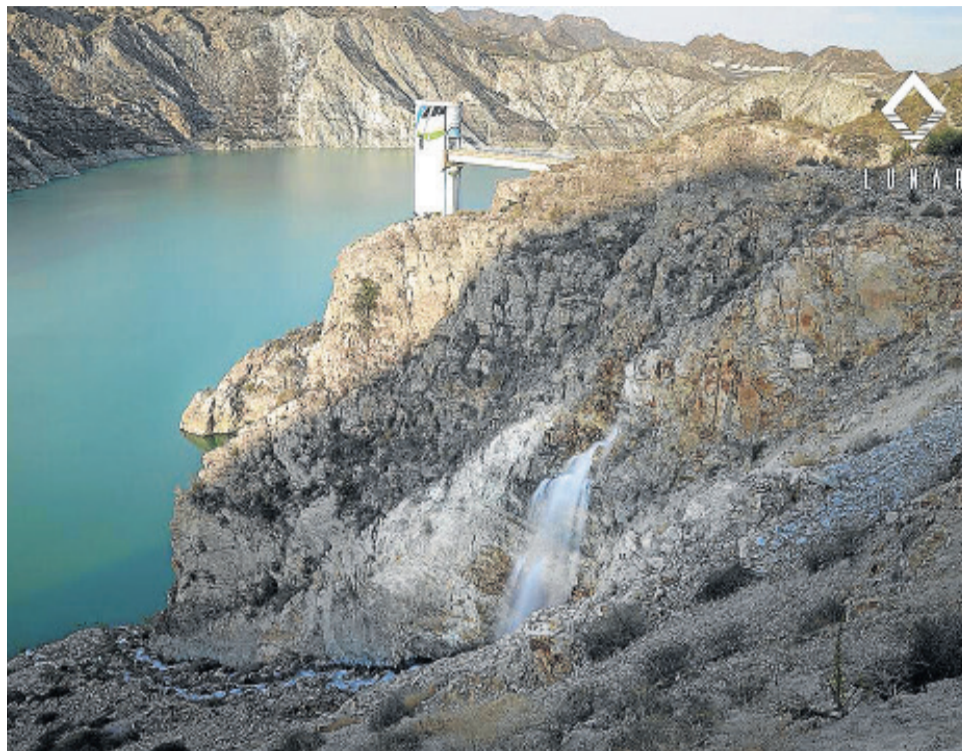
Zona del pantano rodeado por la Sierra Almagro.

Cuevas del Almanzora verá pronto la recuperación del área recreativa del Canal de Remo vinculada además al primer sendero homologado del municipio que permitirá disfrutar y hacer deporte en un entorno privilegiado en Sierra Almagro.