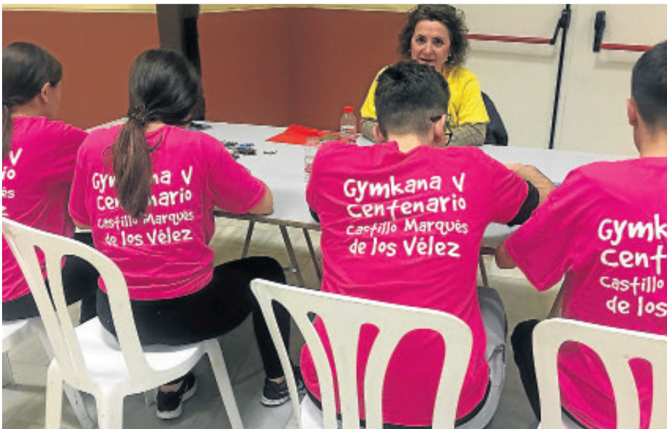
Los jóvenes disfrutaban también de juegos de rompecabezas entorno al Castillo.