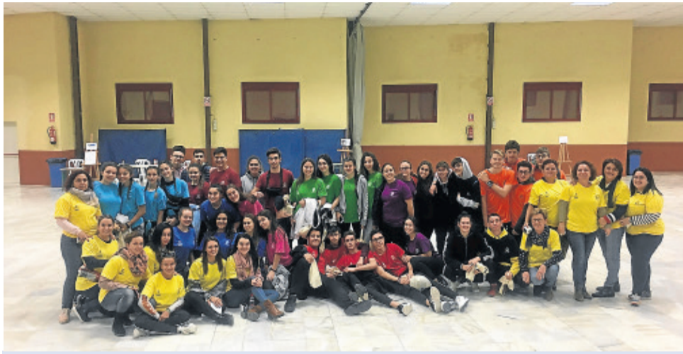
Participantes en la gymkana juvenil en la Nave Polivalente y monitoras.

El Ayuntamiento de Cuevas del Almanzora, a través de la Concejalía de Deportes y Juventud, ha celebrado con éxito la XV Gymkana Juvenil que se ha celebrado en la Nave Polivalente. Esta actividad estaba dirigida a jóvenes de entre 15 y 30 años. Esta edición estuvo dedicada al V Centenario del Castillo del Marqués de Los Vélez.