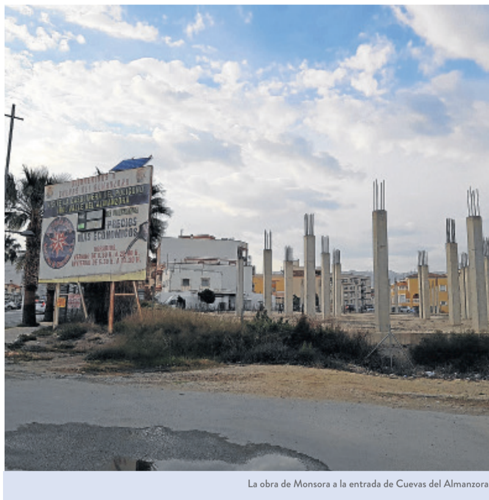
La obra de Monsora a la entrada de Cuevas del Almanzora.

El Tribunal Constitucional ha inadmitido el recurso de casación presentado por el Ayuntamiento y la condena se confirma sin posibilidad de realizar ninguna otra acción judicial. El Consistorio tiene que pagar.