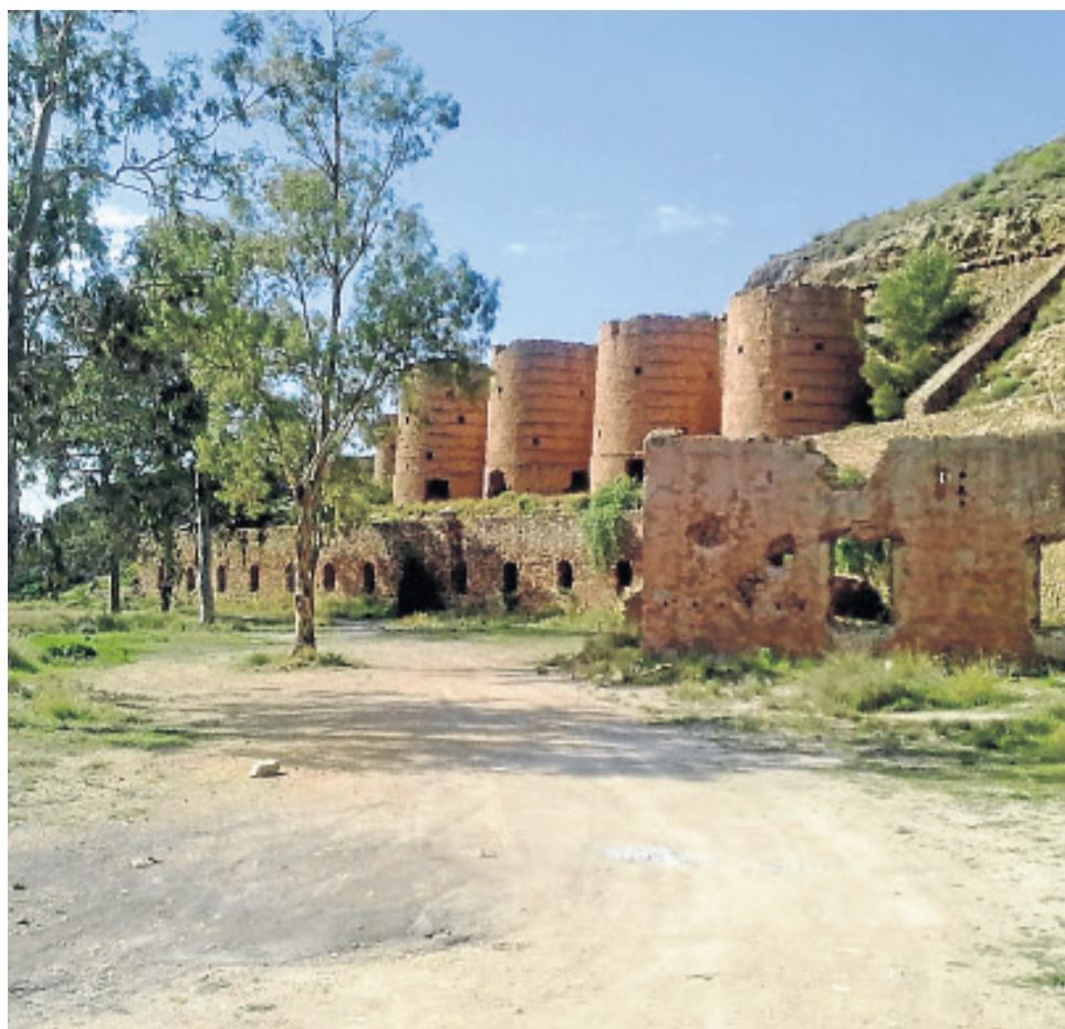
Mina de los Tres Pacos, restos mineros en Sierra Almagro.

De esta forma se llevará a cabo el proyecto de un sendero homologado que supondrá la recuperación