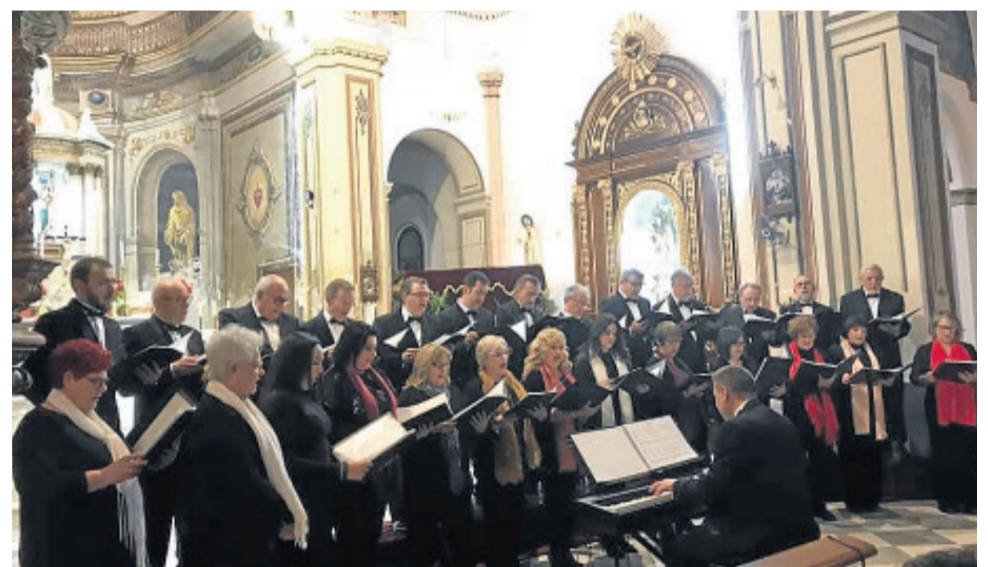
Arriba, los conciertos de Navidad de la Agrupación Musical y el Orfeón Tomás Luis de Victoria. Abajo, actuación de la Escuela Municipal de Música.