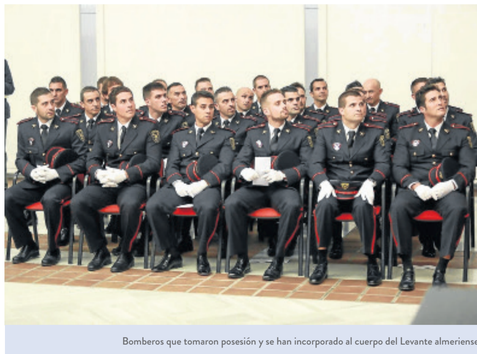
Bomberos que tomaron posesión y se han incorporado al cuerpo del Levante almeriense.

también desde el retén ubicado en Huércal-Overa. Los 26 efectivos que se han incorporado al Consorcio del Levante han realizado sus prácticas durante tres meses en la Escuela de Seguridad Pública y también en el parque de bomberos de Turre junto a sus compañeros más veteranos. Ya están de servicio en las bases del Almanzora y de Turre.