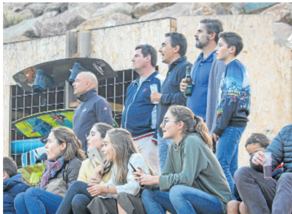
Disfrutando de las actividades en el Canal de Remo cuevano.

Sessions (horario abierto de natación + barbacoa + música), eventos de música en vivo durante el verano, eventos de creación de equipos para empresas privadas, capacitación del equipo nacional para el triatlón, días escolares, con grupos de niños que vienen a disfrutar de nuestras actividades, entre otras muchas. Por supuesto, ofrecemos el Wakeboard, Kayak y SUP, Parque acuático hinchable y un chiringuito donde poder reponer fuerzas en temporada de primavera, verano y otoño.