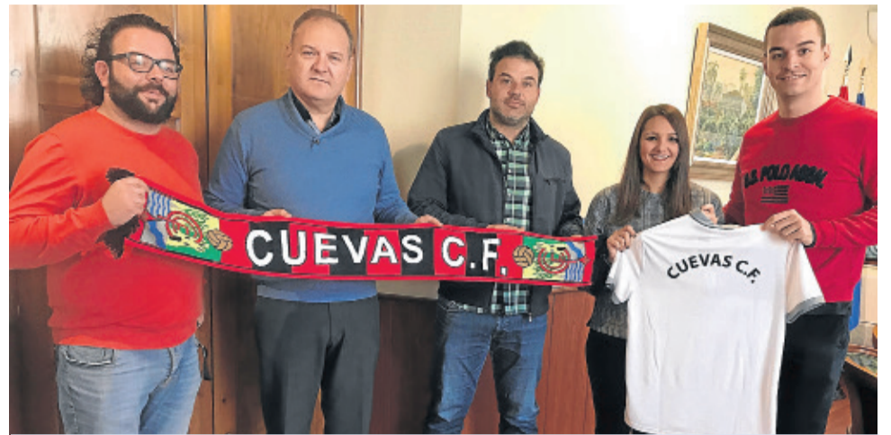
Miembros del Club con el alcalde y la edil de Deportes.

El Ayuntamiento ha renovado un año más el convenio de colaboración con el Cuevas Club de Fútbol, que se centra en la nueva temporada deportiva del equipo, que juega en Primera División Andaluza Senior.