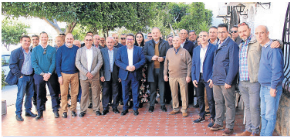
El consejero junto a representantes del Sindicato de Riego de Cuevas en la localidad.