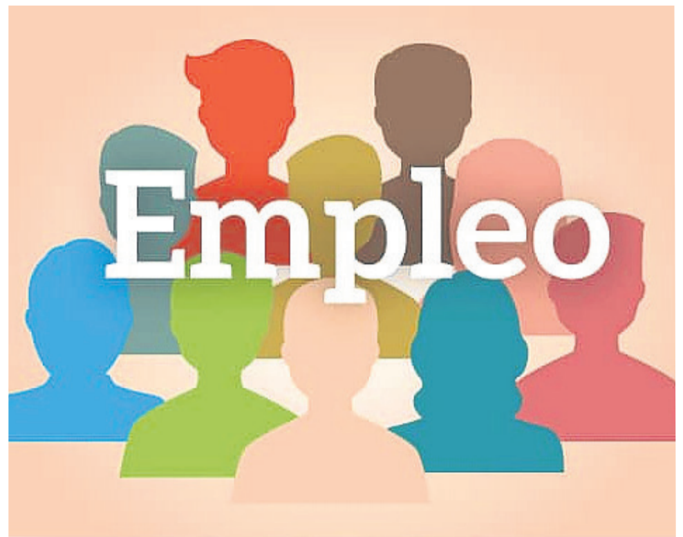
El Ayuntamiento contratará a 49 personas tras ser beneficiario del Programa de Empleo.

Los códigos de ocupación para poder solicitar uno de esos empleos se pueden consultar en las redes sociales del Ayuntamiento de Cuevas del Almanzora, también en las de este mismo medio Cuevas Magazine y en el blog del periódico, así como acudiendo al área de Empleo del Consistorio cuevano.