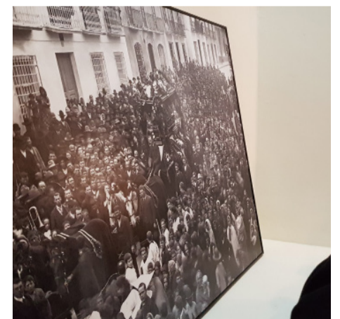
Exposición en el Castillo.