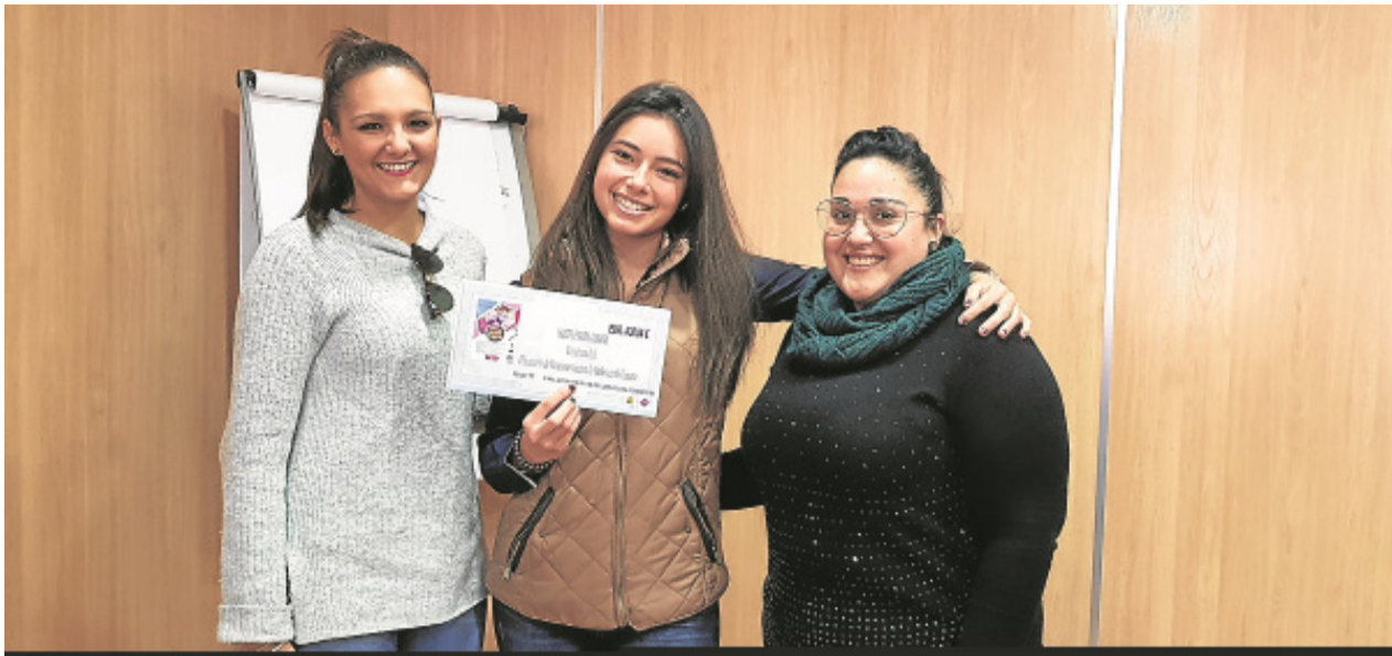
La Navidad ha sido la fecha perfecta para entregar los reconocimientos y regalos de los concursos que se convocaron con motivo de estas entrañables fechas. Arriba, el premio a la canción contra la violencia de género también entregado.